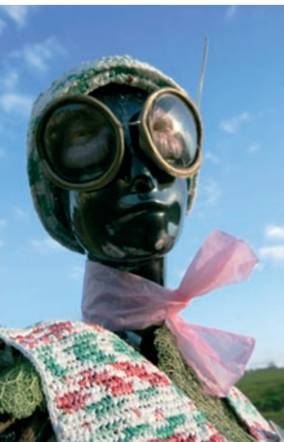
«Un style sobre, cela signifie que tu n'auras jamais l'air d'une orange sur un cure-dents...»