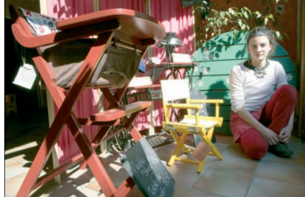
LA GLANERIE « RELOOKE » LES ENCOMBRANTS COLLECTÉS DANS LES RUES